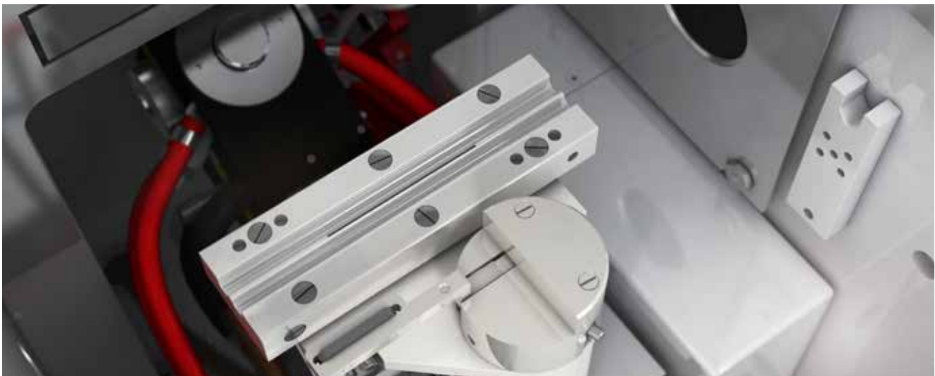
Brennerkopf mit Scraper, sowie abgesenkter Brennerkopf (novAA 800 D)

Der Scraper, ein intelligentes Reinigungsgerät für den Brennerkopf, erleichtert das Arbeiten, besonders bei Verwendung der Acetylen-/Lachgasflamme. Er reinigt den Brennerschlitz automatisch vor jeder Messung sowie im Standby-Modus und garantiert so kontinuierliche und reproduzierbare Messungen in der Routineanalytik, und erhöht die Laborsicherheit und Präzision der Ergebnisse.