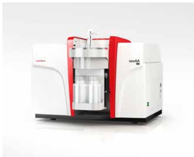
novAA 800 D für Flammen-, Hybrid- und Graphitrohrtechnik